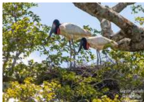
Gabán Goliyú ( Jabiru Mycteria )