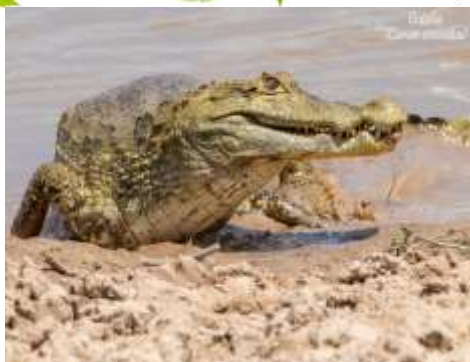
Babilla ( Caimán Crocodilus )