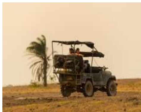
Safari en Jeep