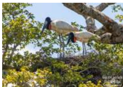
Gabán Goliyú ( Jabiru Mycteria )